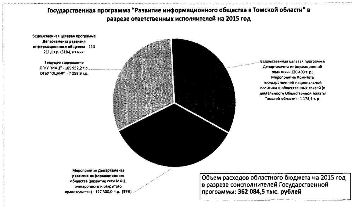
Рис. 1 - Объем расходов областного бюджета в разрезе соисполнителей Государственной программы на 2015 год