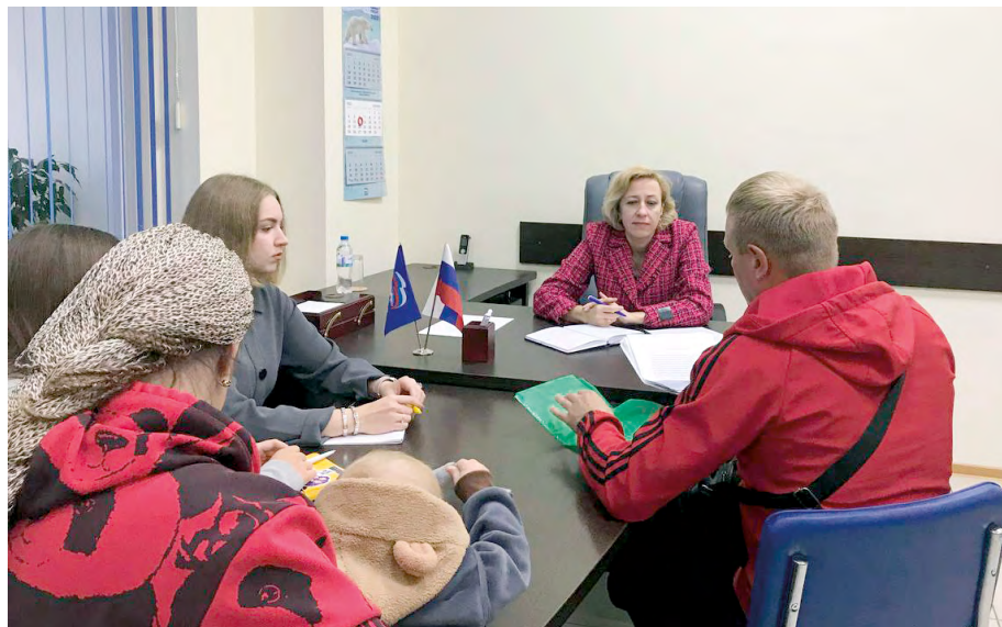
Прием граждан в региональной общественной приемной политической партии «Единая Россия»