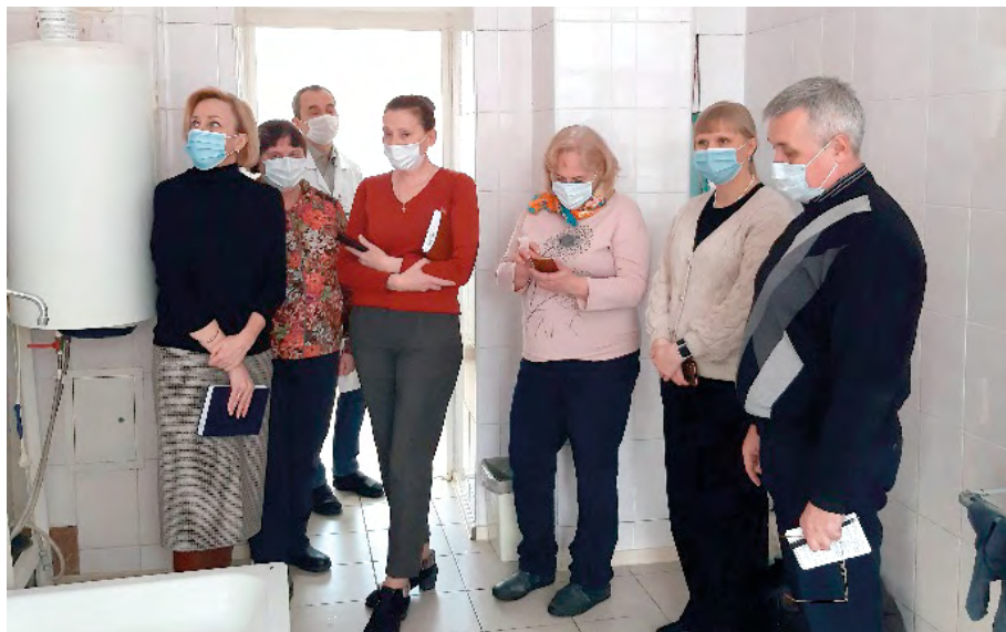
Совместное с ОНК посещение психиатрической больницы