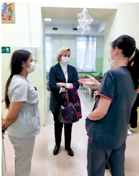
Посещение ОГАУЗ «Томская клиническая психиатрическая больница»