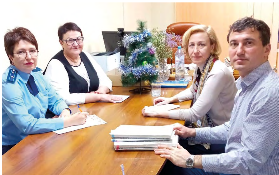
Совещание в доме социального обслуживания «Парус»