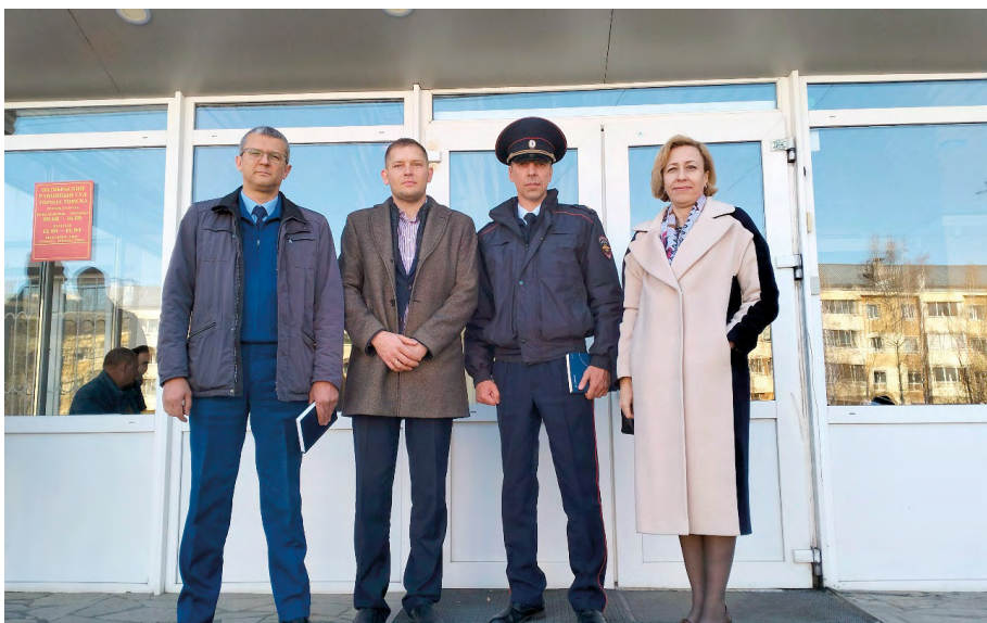
Мониторинг условий содержания в конвойных помещениях судов на территории г. Томска, май 2023