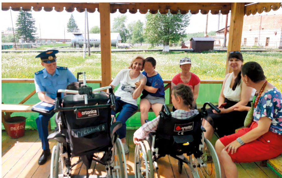
Посещение дома социального обслуживания «Забота»