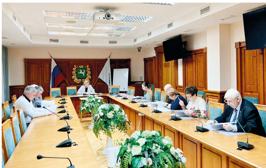
Заседание региональной Комиссии по вопросам помилования