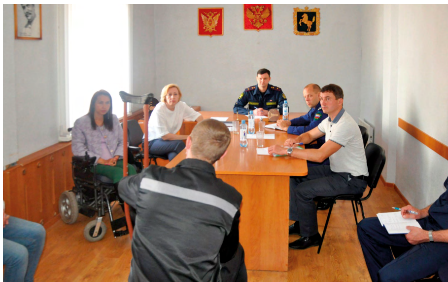
Совместный прием осужденных с ограниченными возможностями здоровья в ФКУ ИК-4 УФСИН России по Томской области, июль 2023