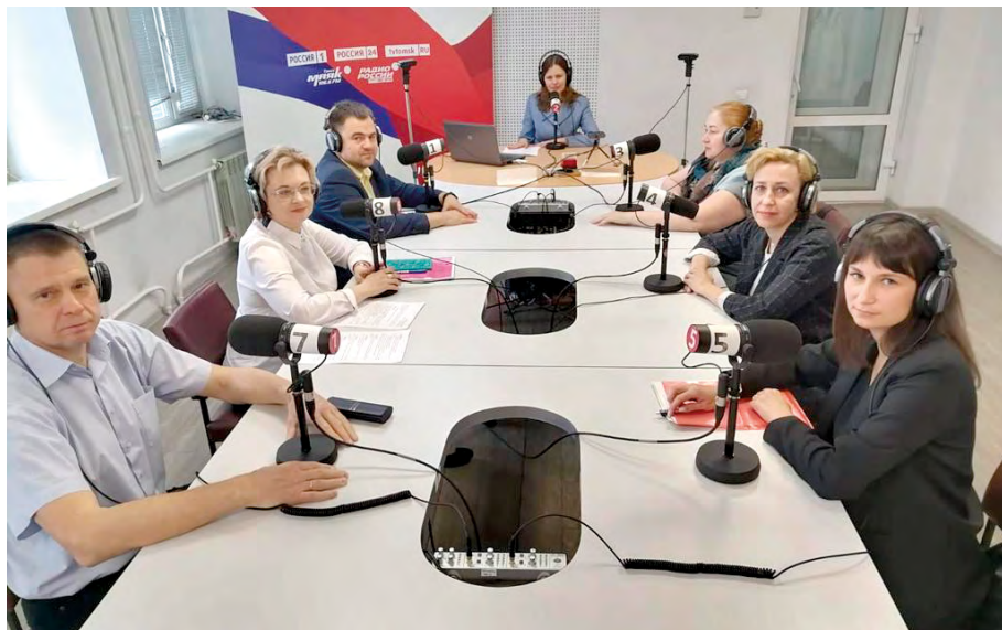
Радио Россия-Томск, прямой эфир программы «Открытая студия»