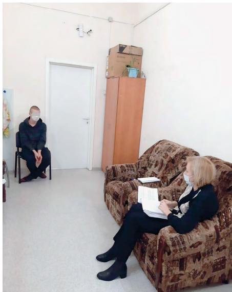
Личный прием в ОГАУЗ «Томская клиническая психиатрическая больница»