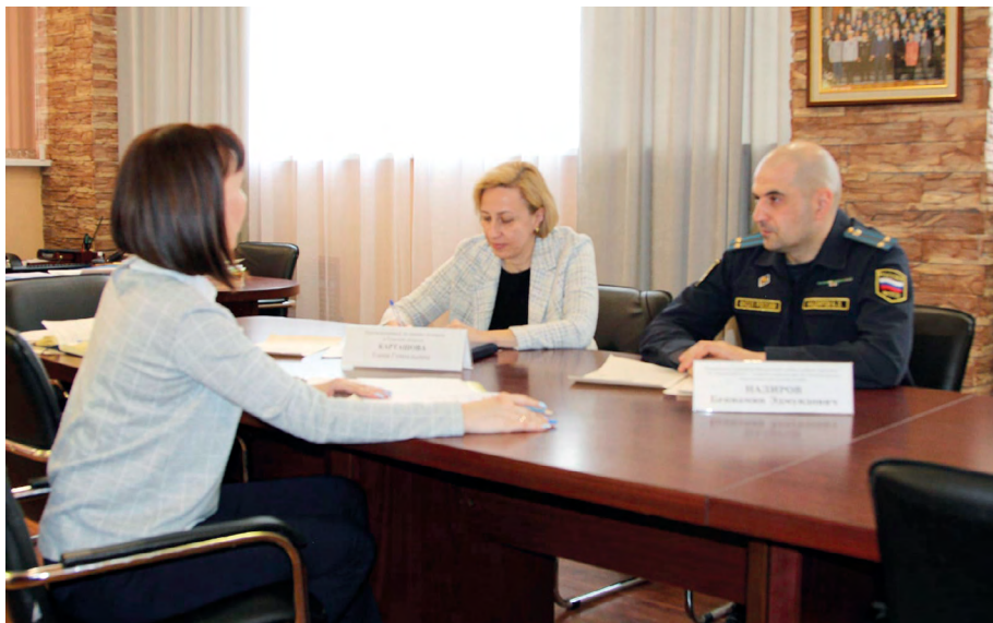
Совместный прием граждан с руководителем Управления ФССП по Томской области Б. Надировым