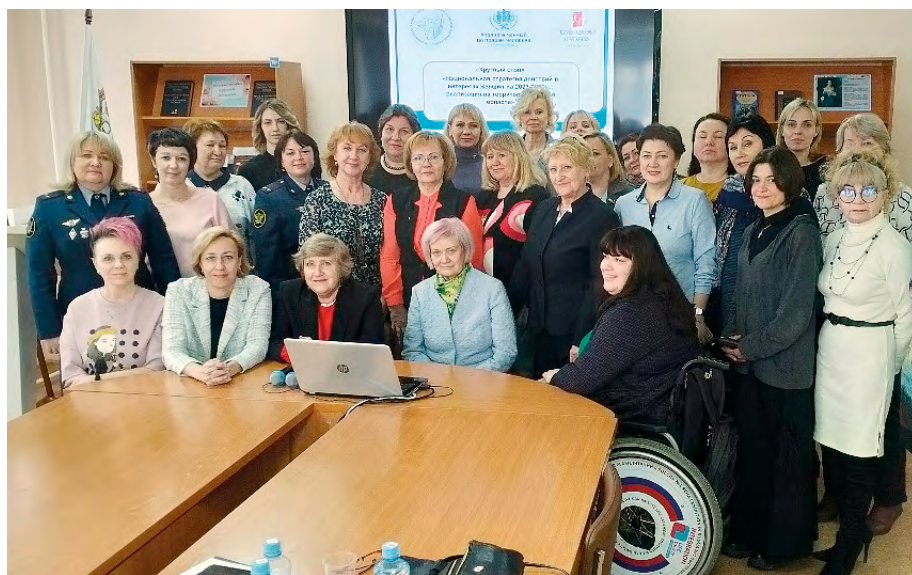
Участники круглого стола на тему «Национальная стратегия действий в интересах женщин на 2023–2030 гг.: реализация на территории Томской области»