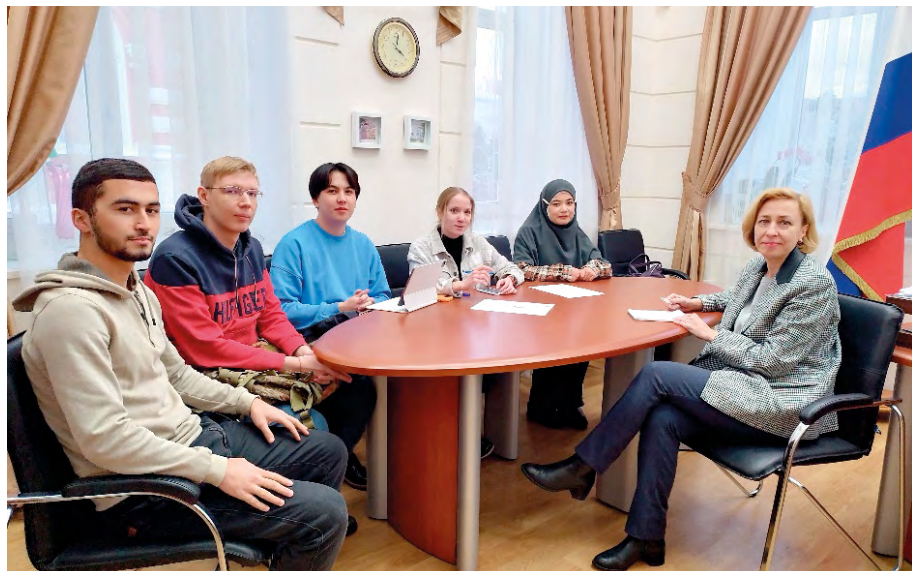
Встреча со студентами факультета исторических и политических наук НИ ТГУ