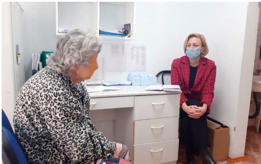
Личный прием в доме-интернате для престарелых и инвалидов «Лесная дача»