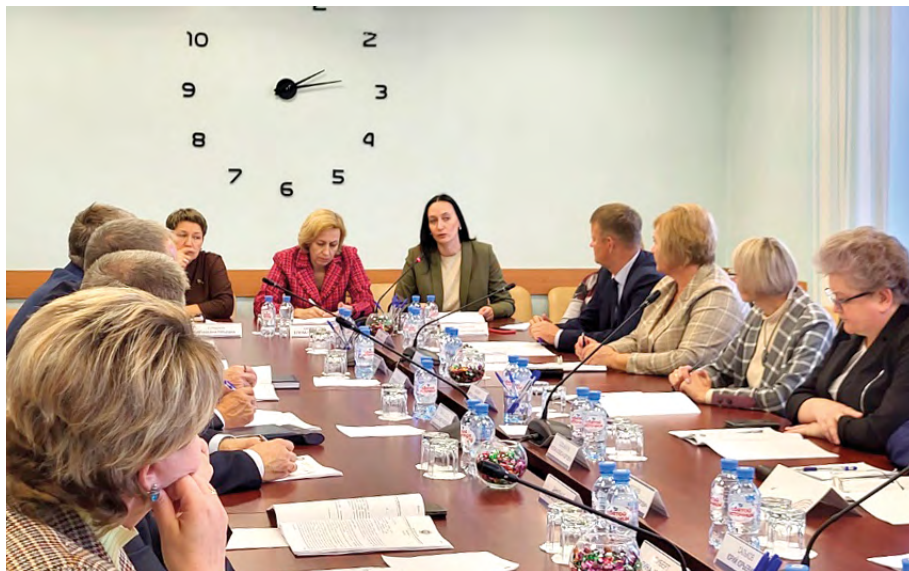
Выступление на заседании Президиума Ассоциации муниципальных образований Томской области