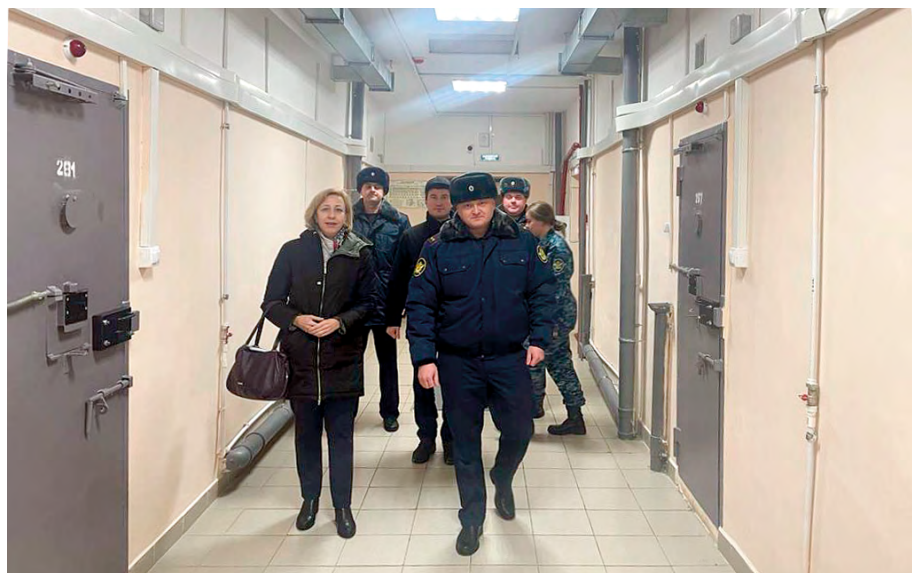
Проведение обхода камерных помещений в ФКУ СИЗО-1 УФСИН России по Томской области, декабрь 2023