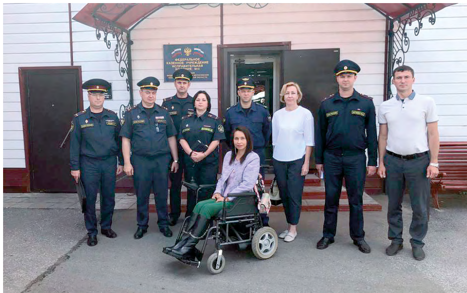
Выезд в ФКУ ИК-4 УФСИН России по Томской области для проведения совместного приема осужденных с ограниченными возможностями здоровья, июль 2023