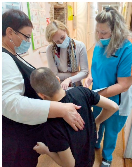
Посещение дома социального обслуживания «Парус»