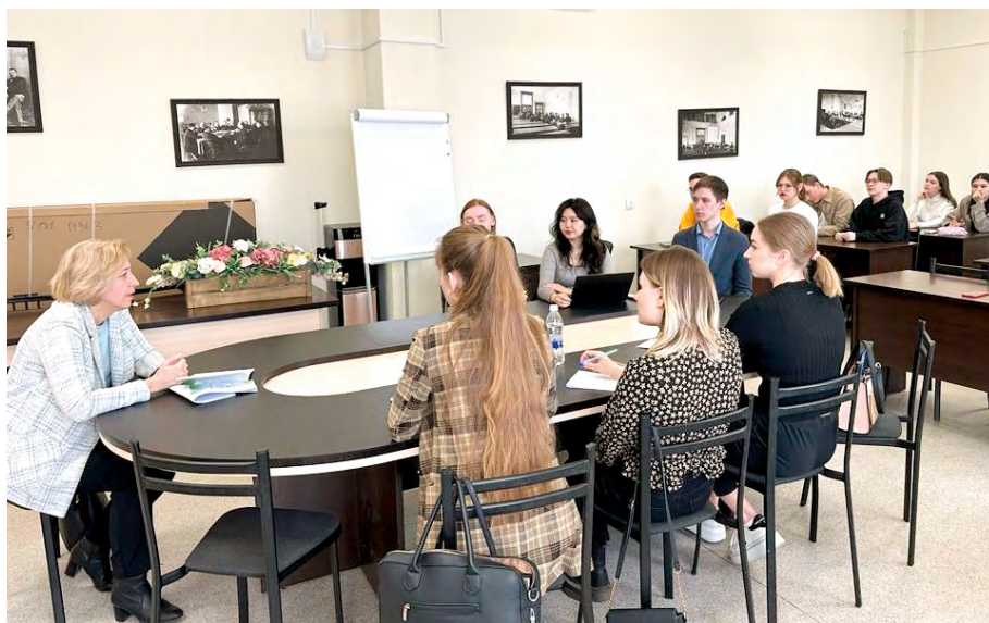
Тренинг для студентов ЮИ НИ ТГУ