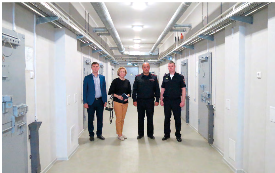
Посещение изолятора временного содержания УМВД России по ЗАТО Северск, август 2023