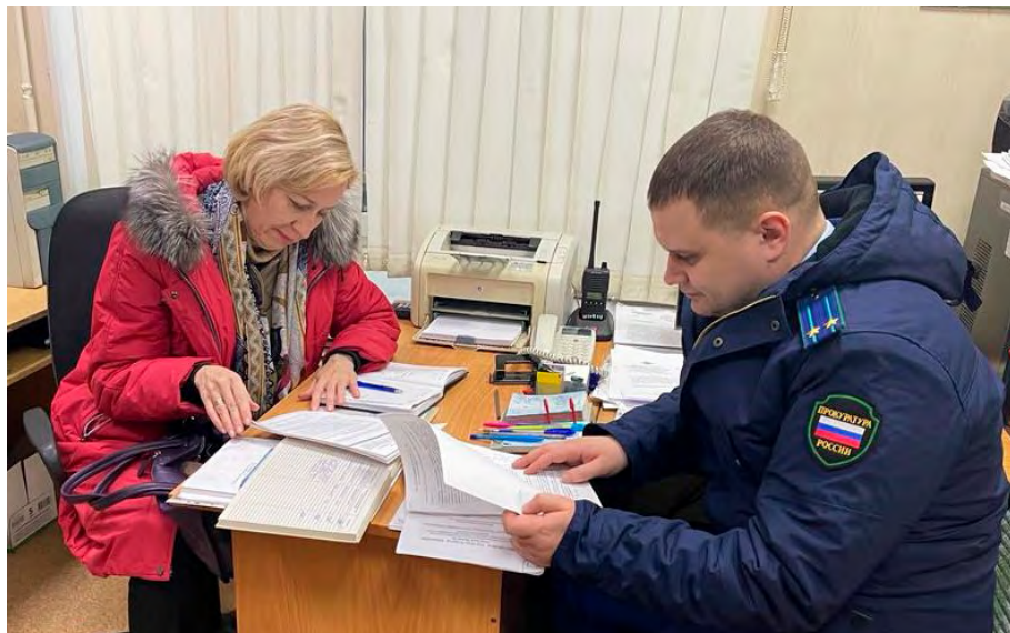
Совместная проверка изолятора временного содержания Кожевниковского района, январь 2023