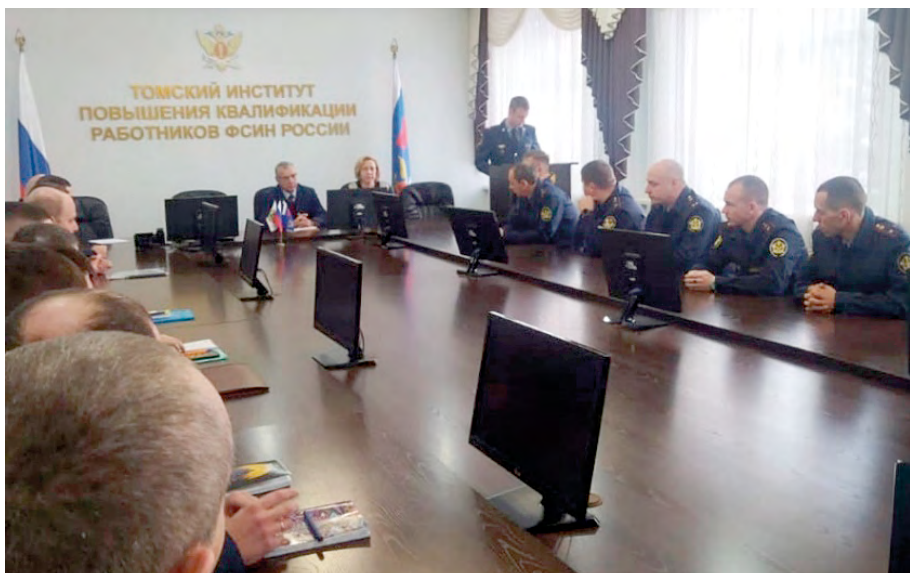
Лекция о правах человека в ФКУ Томский институт повышения квалификации работников ФСИН России