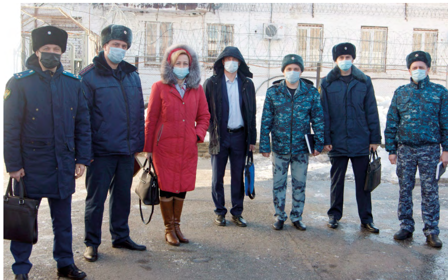
Выезд в ФКУ ЛИУ-1 УФСИН России по Томской области для проведения совместного приема граждан, отбывающих наказание в виде лишения свободы, март 2023