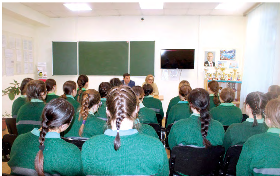
Лекция в Томской воспитательной колонии №2