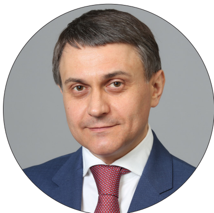
СЕРГЕЙ АВТОМОНОВ — ПРЕДСЕДАТЕЛЬ КОМИТЕТА ПО СТРОИТЕЛЬСТВУ, ИНФРАСТРУКТУРЕ И ПРИРОДОПОЛЬЗОВАНИЮ

ВАЖНАЯ ЧАСТЬ ДЕПУТАТСКОЙ РАБОТЫ — ЭТО ПРЕДСТАВЛЕНИЕ ИНТЕРЕСОВ ЖИТЕЛЕЙ ОКРУГА, А ТАКЖЕ ИНИЦИИРОВАНИЕ, ПОДГОТОВКА И ПРИНЯТИЕ ОБЛАСТНЫХ ЗАКОНОВ.